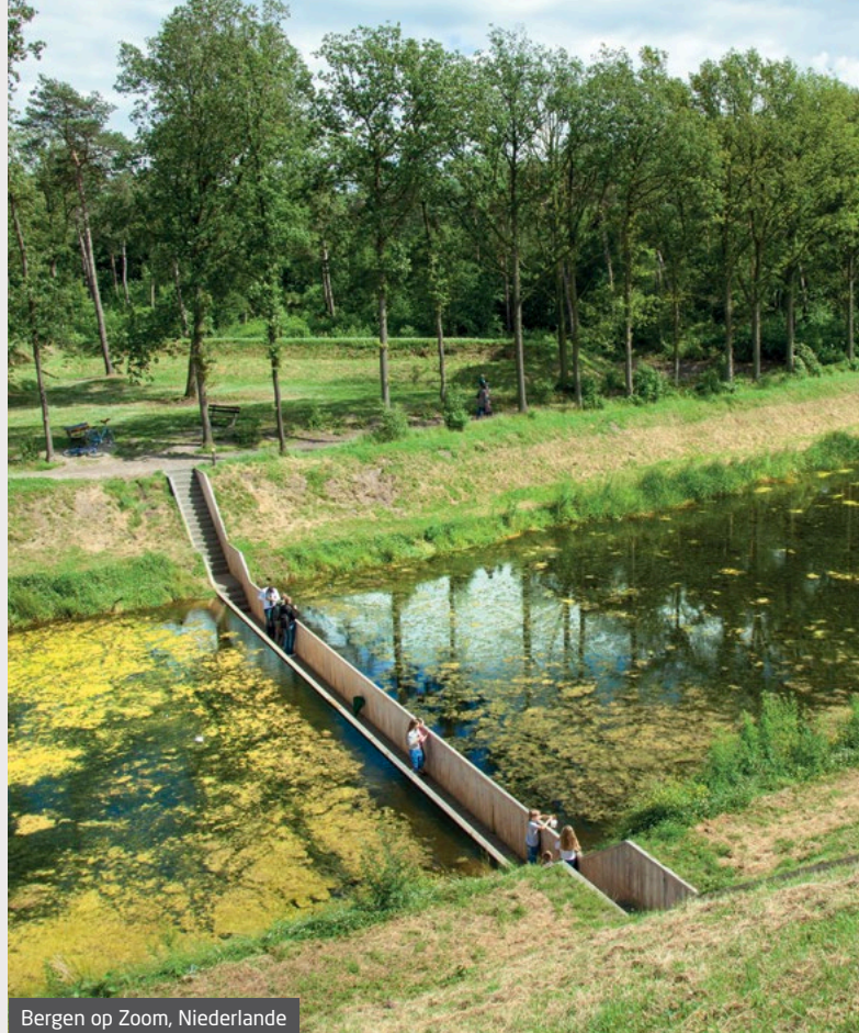
Bergen op Zoom, Niederlande

Stellen Sie sich ein Holz vor, das in zunehmendem Maße die knappen tropischen Harthölzer, behandelte Hölzer und weniger nachhaltige Materialien in neuen und bestehenden Außenanwendungen ersetzen kann. Stellen Sie sich ein Holz vor, das während seines ausgedehnten Lebenszyklus zu einer besseren CO 2 -Bilanz beiträgt und am Ende sicher wiederverwertet werden kann. Solch ein Holz existiert. Es ist Accoya®: das weltweit führende High-Tech-Holz.