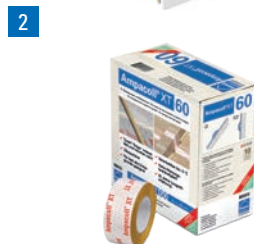
2 Ampacoll® XT 60: Acrylklebeband